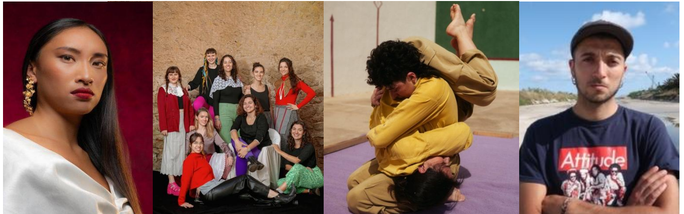
Imatges: òpera Turandot, grup Pitxorines, peça de dansa S'Albufera i artista Rudimentary.

(Si el text té menys de 155 paraules, no es corregirà i es qualificarà amb 0 punts.)