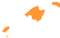
b) Illes Balears