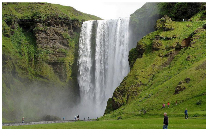
La cascada de Skógafoss, a la costa est d'Islàndia, és una de les més espectaculars de l'illa

Q ue Islàndia és un país meravellós ja fa temps que no és cap secret. El paisatge volcànic, les cascades, els llacs d'aigua calenta, els fiords, els cavalls i el sol de mitjanit captiven des de fa anys milers de turistes. Curiosament, va ser la revolució silenciada dels islandesos, sorgida amb la crisi econòmica del 2008, el que va començar a disparar el nombre de turistes. També hi va ajudar, dos anys després, l'erupció del volcà Eyjafjallajökull. De sobte, gent de tot el món va tenir ganes de viatjar a aquella illa remota.