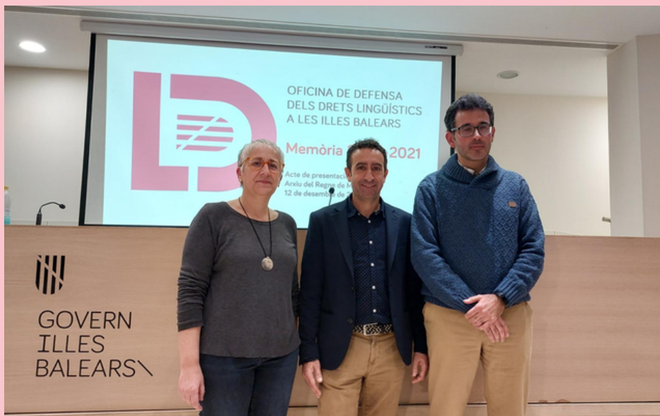
Presentació de la Memòria 2020-2021 a l'Arxiu del Regne, a Palma

Està previst que el conseller de Fons Europeus, Universitat i Cultura comparegui pròximament davant el Parlament per retre comptes de la memòria de l'Oficina, tal com estableix el Decret esmentat.