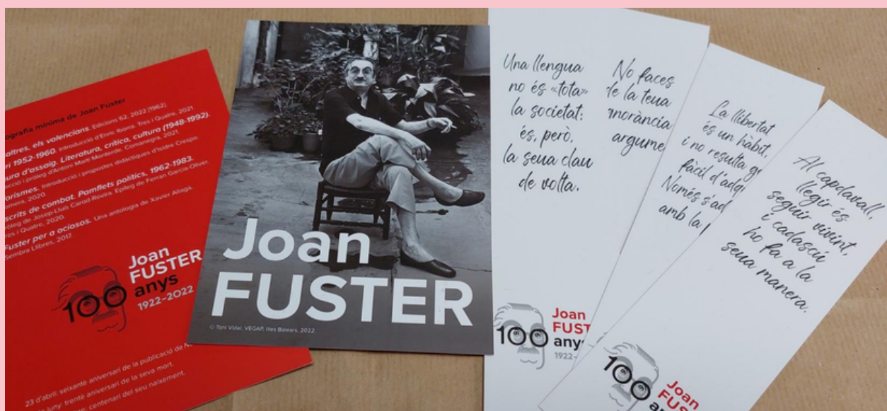
Mostra de material de l'Any Joan Fuster editat pel Govern de les Illes Balears

El Govern de les Illes Balears, juntament amb Generalitat Valenciana i la Generalitat de Catalunya, celebren l'Any Joan Fuster en reconeixement de la persona i la trajectòria d'un dels intel·lectuals més importants del segle XX, referent cívic del moviment de normalització de la llengua catalana, i en agraïment per la seva aportació a l'enriquiment de la cultura catalana.