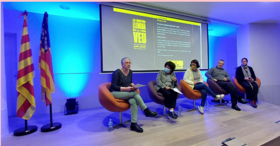
Presentació del Projecte AINA a Palma el passat mes d'abril

Amb la finalitat d'animar els ciutadans de les Illes Balears a participar-hi, el Govern ha impulsat una campanya de comunicació. Els ciutadans han respost molt bé a aquesta crida de participació, formulada mitjançant una sèrie de vídeos, falques i gràfics amb un to informal i proper: tan sols el primer dia de la campanya els talls enregistrats es van triplicar i van passar de dues a sis hores. Això suposa que es van fer més de 4.600 enregistraments, mentre que el dia anterior se n'havien fet 1.565. Els dies posteriors, es va mantenir una participació elevada, entorn dels 3.000 enregistraments diaris.