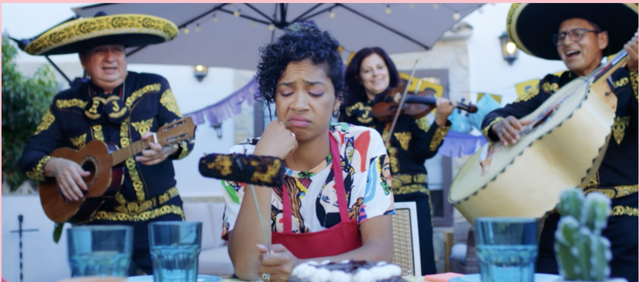
Imatge promocional de l'espot elaborat pel Govern de les Illes Balears

Així, s'ha creat un corpus de llengua per entrenar els algoritmes d'intel·ligència artificial i poder generar models de llengua, de parla i de traducció. Aquests models serviran per desenvolupar solucions o serveis específics (traductors, assistents personals, sintetitzadors de veu, classificadors de texts, etc.) en llengua catalana.