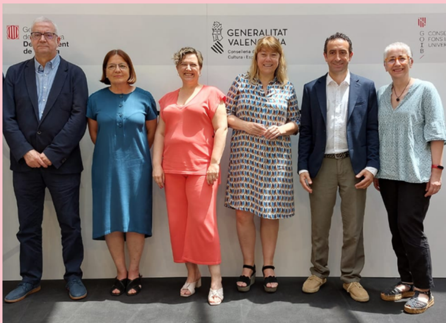
Acte conjunt dels tres governs a Sueca el passat 4 de juny