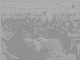
El año pasado la cena fue un éxito de participación.

Esta noche se inicia en Sóller la segunda edición de la Fira del Gerret con una cena popular a base de este delicioso y poco valorado pescado. El Govern también presentará esta tarde un audiovisual sobre esta especie. La Fira se inaugura mañana sábado en el campo de deportes del Port de Sóller donde se podrán degustar muchos platos.