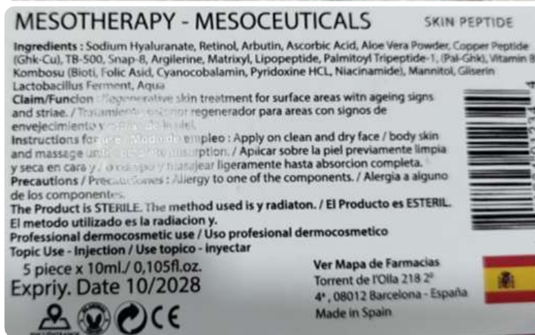
Imagen del producto y etiquetado de Skin Peptide, comercializado bajo la marca VANE-Mesoceuticals