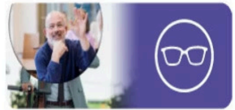
Educación de Personas Adultas