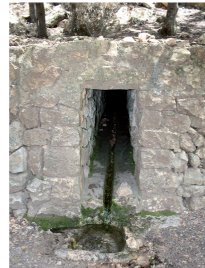
Font des Polls (Esperança Perelló)

Envoltant la font observam diversos polls ( Populus nigra ) que donen nom a la font. Els podem trobar també a gorgs, basses, torrents i altres fonts de la Serra perquè és un arbre exigent en demanda d'aigua.