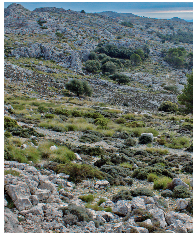
Aritges i eixorba-rates blancs al pla de ses Aritges (Esperança Perelló)

Més endavant, el camí arriba a un pinaret on es creua amb el camí de ses Fontanelles que ens portaria de nou al pla des Pouet. Nosaltres seguim recte pel camí de s'Arxiduc.