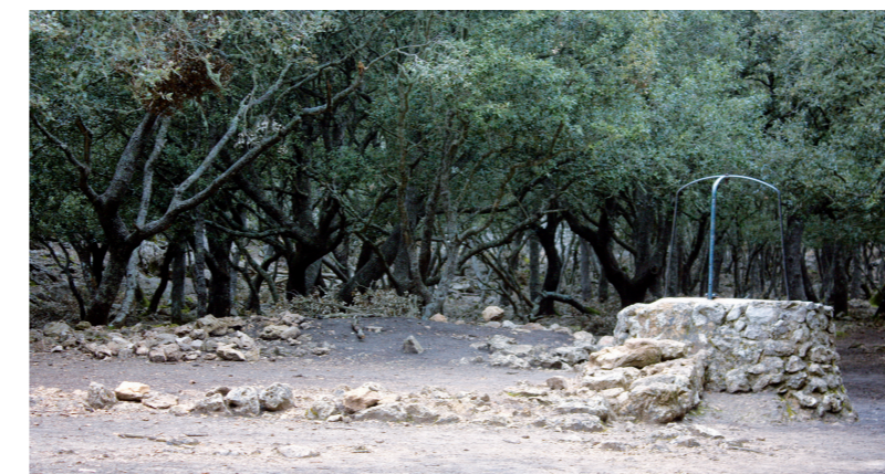
Pla des Pouet (Esperança Perelló)

Seguim el camí que en línia recta des del portell ens du fins al pou que dona nom al pla.