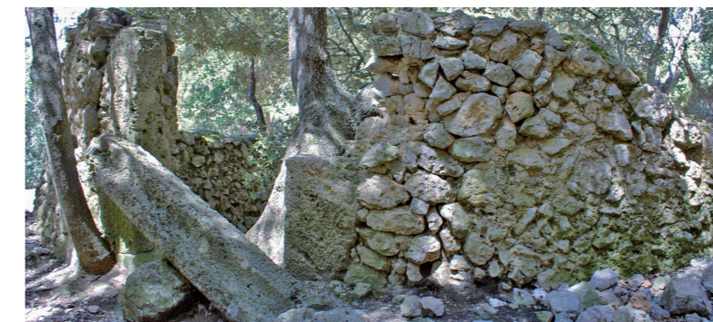
Casa de neu de Son Moragues (Esperança Perelló)

L'ofici de nevater era ben dur. Primer havien de recol·lectar la neu dels voltants i dur-la fins a la casa. Un cop allà, la tiraven dins la casa a través d'uns finestrons anomenats bombarderes, i aleshores la compactaven amb pilons o masses de fusta. Els nevaters es rellevaven pel perill de congelació.