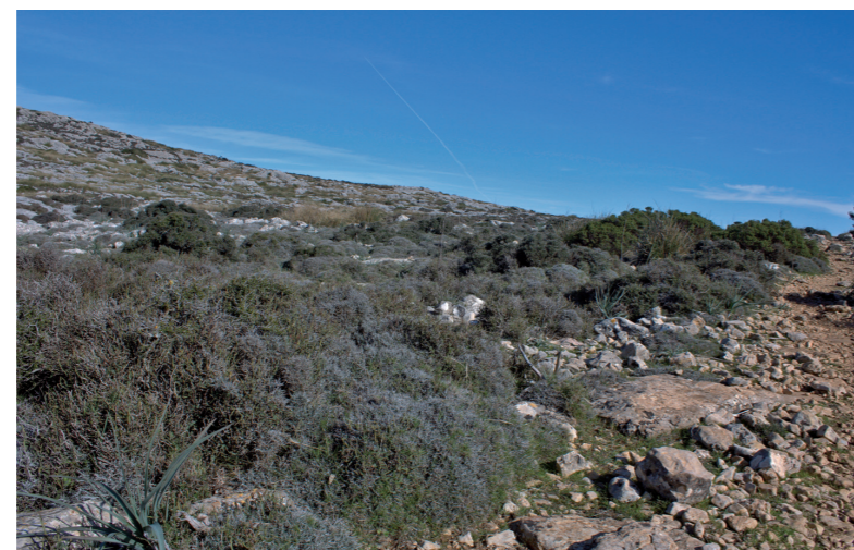
Pla de ses Aritges (Esperança Perelló)

Si ens girem al nostre voltant, veurem uns arbusts arrodonits, en forma de coixinet. No els toqueu, que espinen! Es tracta de l'arritja balearica ( Smilax aspera subsp. balearica ), que dona nom al pla, i de l'eixorba-rates blanc ( Teucrium marum ) que són plantes endèmiques de