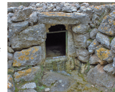
Font de s'Abeurada (Esperança Perelló)

Iniciam l'itinerari al nucli de Valldemossa. El camí comença al fons del carrer de les oliveres i transcorre al principi amb suau pendent fins a una barrera de metall amb un botador de fusta. A l'altra banda del botador continuam uns vint metres fins que el camí marca un fort revolt a mà dreta. Si en aquest punt ens desviam dues passes a mà esquerra, trobam una font de mina. Es tracta de la font de s'Abeurada que devia proporcionar aigua als carboners que treballaven aquests boscos.