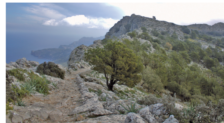
Vista del camí de s'Arxiduc (Esperança Perelló)

En aquestes terres l'Arxiduc va combinar un respecte escrupolós del paisatge natural i del medi ambient. Les seves terres estaven obertes per a que tothom pogués visitar el que ell mateix qualificava com a parc natural.