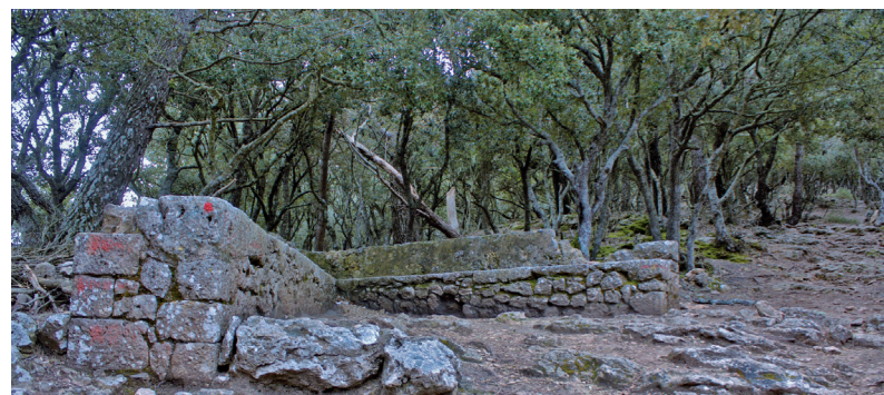
Pedrissos des coll de Son Gallard (Esperança Perelló) Sa Foradada des del camí de s'Arxiduc (Esperança Perelló)

En el Die Balearen de l'arxiduc Lluís Salvador aquesta cova apareix amb la denominació de cova de s'Ermità de Son Moragues.