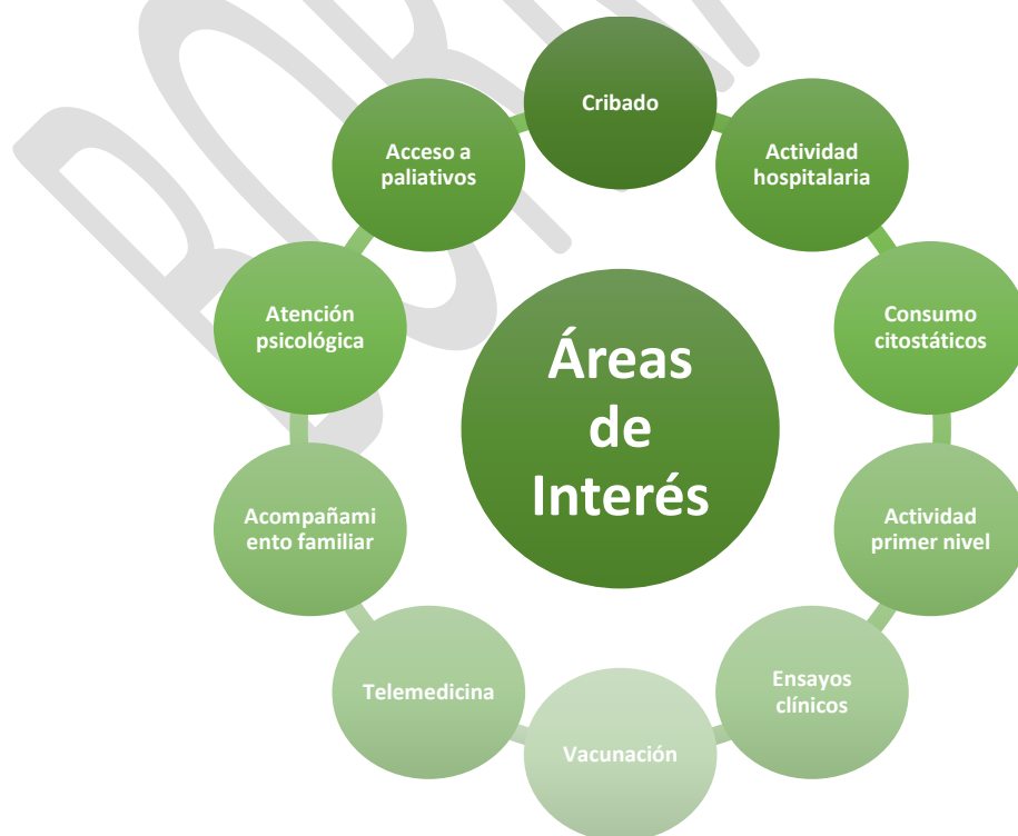
Figura 2: Áreas de Interés